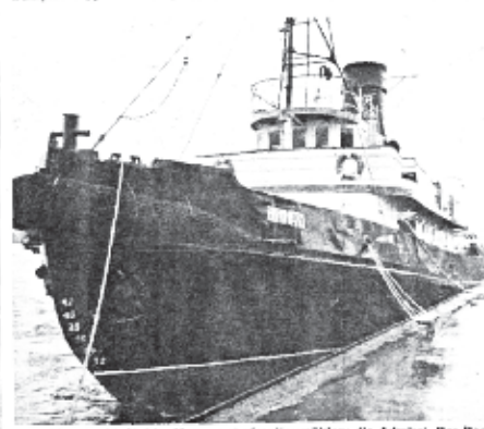
Liegt bis zum 21. Mai im Museumshafen Neumühlen; die Admiral. Der Dampfschlepper kann täglich von 11 bis 22 Uhr besichtigt werden.