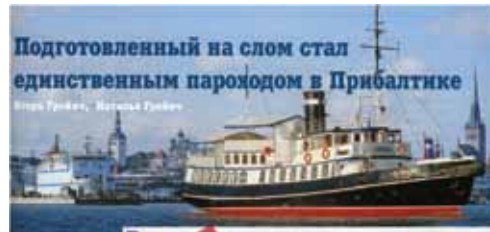
Подготовленный на слом стал единственным пароходом в Прибалтике