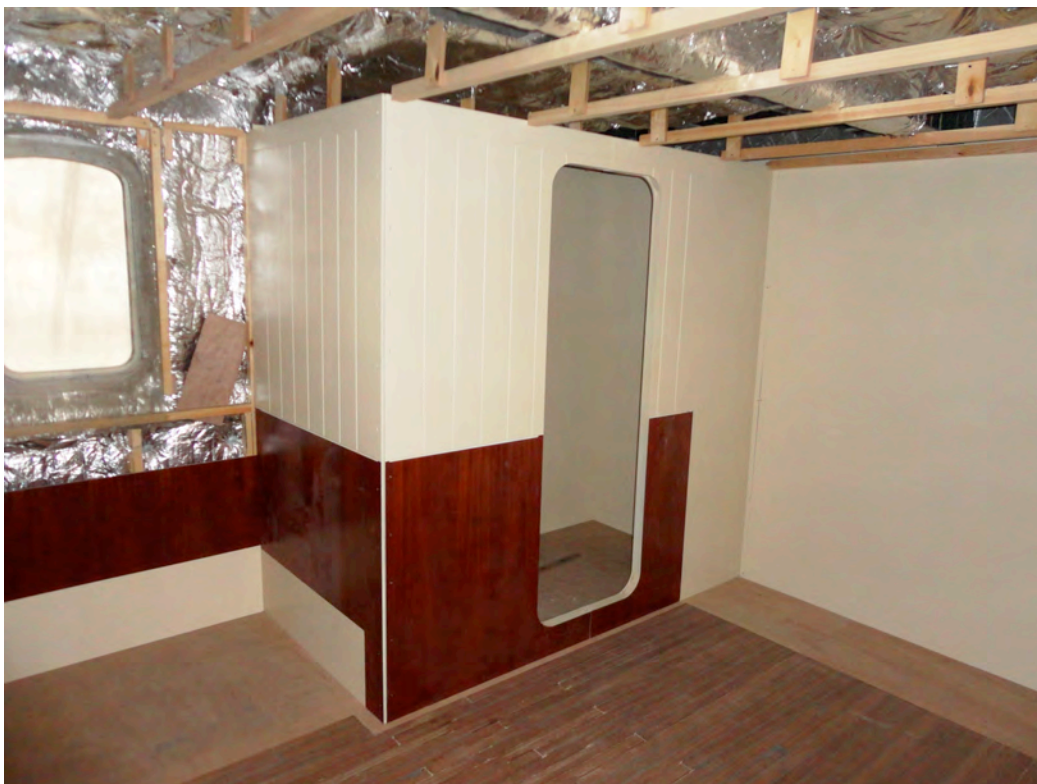
Помещение ходового мостика – монтаж палубного покрытия по уложенной изоляции плавающего пола